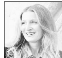
FASHION Chief Editor

rédactrice en chef mode, continue à apporter son regard sur la mode de GRAZIA.